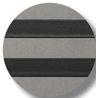
Cancelli e recinzioni perimetrali